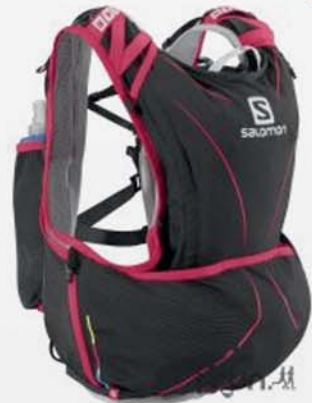
Sac SLAB Salomon 5 et 12litres ENDURANCE SHOP