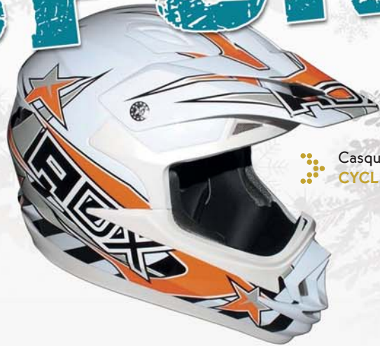
Casque moto - 89 € CYCLES BACHELAS