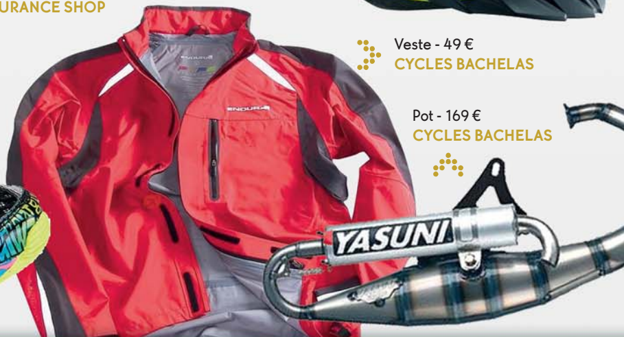
Veste - 49 € CYCLES BACHELAS