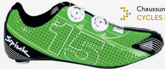
Chaussures - 120 € CYCLES BACHELAS