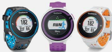
Forerunner 220 et 620 GARMIN ENDURANCE SHOP