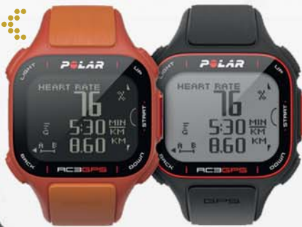
Montre Polar RC3 GPS ENDURANCE SHOP