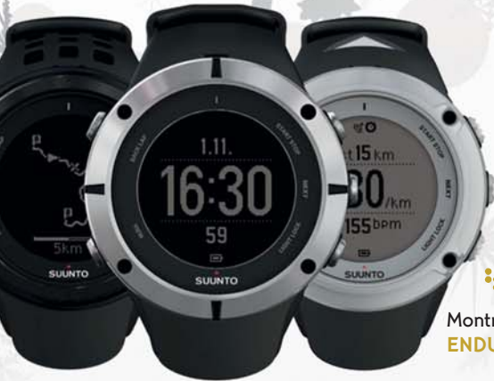
Montre Suunto Ambit 2 ENDURANCE SHOP