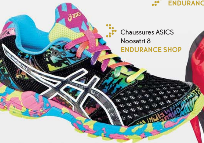
Chaussures ASICS Noosatri 8 ENDURANCE SHOP