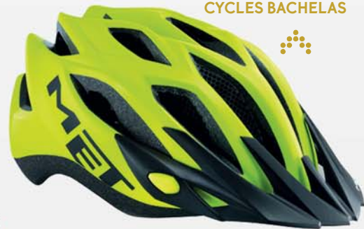
Casque vélo - 55 € CYCLES BACHELAS