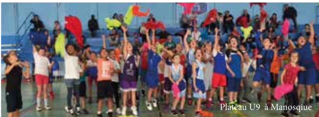
Plateau U9 à Manosque