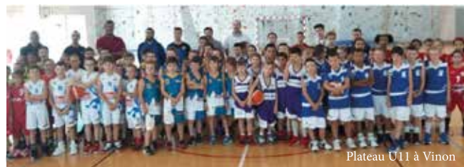
Plateau U11 à Vinon

Dès le plus jeune âge, les enfants sont initiés au basket de façon ludique, des jeux parents/enfants, et le tout dans un esprit de convivialité et de bonne humeur !